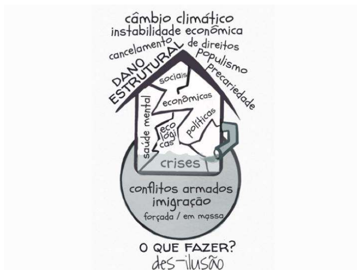
Figura 4 - Danos estruturais na casa construída pela modernidade