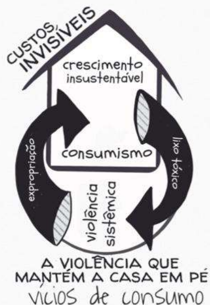
Figuras 1 e 2 - A construção da casa da modernidade e seus custos escondidos

As fundações desta "casa da modernidade" são construídas em uma base de concreto que separa humanos do resto da natureza, criando uma escala de valores que compara e ordena estes seres supostamente separados de acordo com sua utilidade percebida. Uma das paredes da casa é representada por azulejos compostos de valores Humanistas ocidentais e tradições de saberes do Iluminismo, recheadas de promessas de consenso e relevância universais. Na outra parede, a sustentação é feita pelos Estados-nação, os quais prometem segurança através dos mecanismos de fronteira, direitos e homogeneidade nacional. Os azulejos do teto da casa são o capitalismo global, organizado em camadas contínuas de crescimento econômico e consumo como indicadores de progresso e civilização. Enquanto a construção da casa da modernidade oferece promessas reluzentes, essas promessas são subsidiadas por uma camada