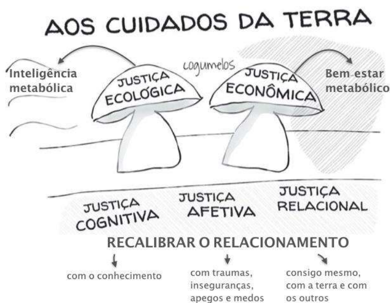
Figura 5 - Modelo de Justiça Global "Aos Cuidados da Terra"

Como parte desta pesquisa, construímos estudos de caso colaborativos de diferentes iniciativas e organizações, mas para discussões entre nós e com nossos colaboradores, e considerando o que será mais útil para o aprendizado de nossos estudantes e outros esforçando-se para fazer sentido de uma casa desmoronando. Os resultados primários de pesquisa deste trabalho não são relatórios de nossas "descobertas" empíricas, mas sim modelos pedagógicos continuamente revisados, experimentos artísticos e cartografias sociais. Uma destas é o Marco de Justiça Global "Aos Cuidados da Terra" (Andreotti, Stein, Rene, coletivo, 2019), uma cartografia que integra as dimensões ecológica, cognitiva, afetiva e relacional de transformação, que são frequentemente abordadas isoladamente ou em pares. Particularmente, usamos a metáfora do cogumelo, representando as dimensões ecológicas e econômicas da transformação, e embaixo delas, o micélio das dimensões cognitiva, afetiva e relacionais, responsáveis por alimentar o cogumelo e permitir a ele viver e, na hora certa, morrer também.